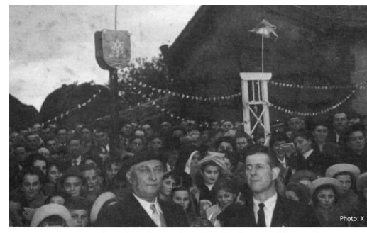
Sur le parvis, le jour de la bénédiction de la Chapelle du village de la Roche en 1953. Photo publiée en 1960 dans le livre de Régine Albert, "IL était une fois le Petit-Bourg-des-Herbiers."