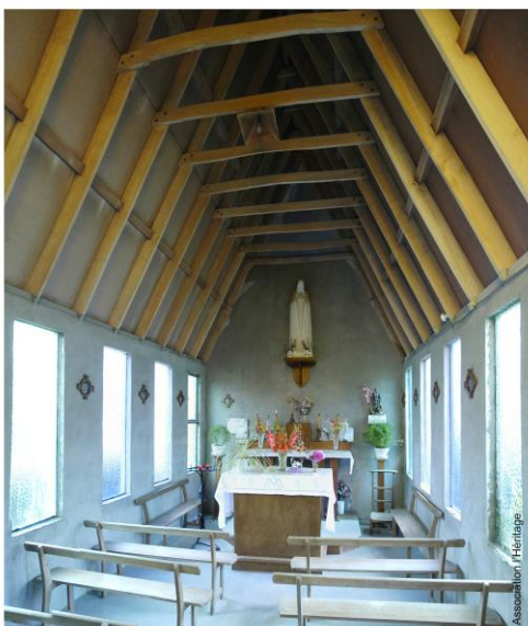
Chapelle de la Roche-Thémér - 13 septembre 2015

Chapelle privée du village de la Roche-Thémér (association non déclarée à l'époque), construite sur terrain communal prévu pour un lavoir, elle est devenue propriété communale, selon l'acte du 4 avril 1990. Elle est dédiée à Notre-Dame-de-la-Trinité, en lien avec le sanctuaire Notre-Dame-de-la-Trinité de Blois en Loir-et-Cher; lui-même édifié entre 1932 et 1949 « pour l'extension de la prière des 3 Ave Maria », érigé en basilique en 1956 par le pape Pie XII et géré par les frères Capucins du couvent de Blois.