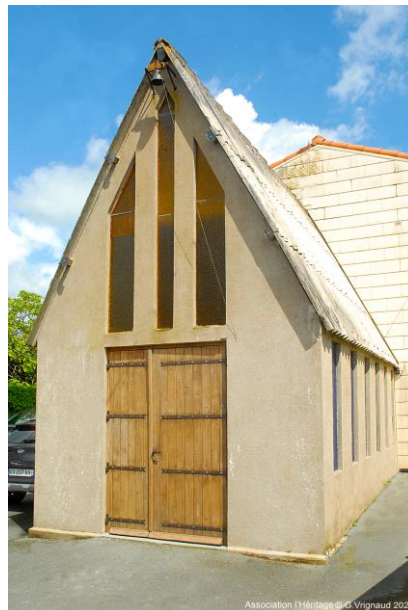
Association l'Heritage © G. Vignaud 2024