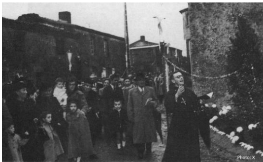
Au coeur du village, ce 1 novembre 1953, la procession conduit à la Chapelle. Photo publiée en 1960 dans le livre de Régine Albert, "IL était une fois le Petit-Bourg-des-Herbiers."

La Mission d'avril 1939 avait permis la bénédiction de l'oratoire Sainte-Thérèse le 10 avril ; celle de 1950, la bénédiction du calvaire restauré du bourg (actuellement dans le cimetière de l'Aurore). En 1953 , lors du retour de Mission le 1 er novembre , c'est la bénédiction de la Chapelle Notre-Dame-de-la-Trinité . Elle est érigée en oratoire le 10 décembre 1954 et le chemin de croix est inauguré le 23 janvier 1955 par l'abbé Poirier, curé du Petit-Bourg.