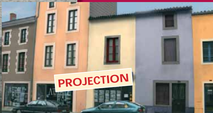
Exemple de couleurs que pourraient revêtir les bâtiments existants en respectant la charte de couleur

la couleur obtenue dépend des sables utilisés ou de l'emploi d'un badigeon. Il vous sera demandé de présenter plusieurs échantillons réalisés in situ au moins 15 jours avant.